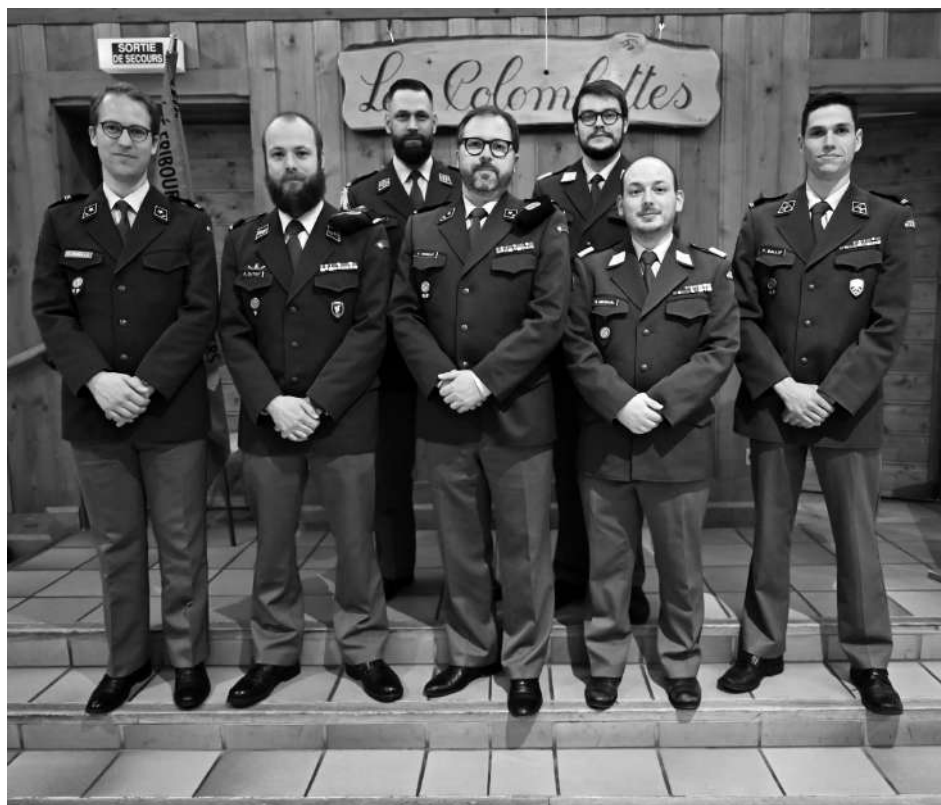
Le nouveau comité de la section Gruyère/Veveyse de la Société fribourgeoise des officiers

culier sur les jeunes officiers : ce sont eux qui nous remplaceront et feront perdurer nos traditions et notre armée de milice : « Une tradition qui sait s'adapter et donc qui vit est plus importante qu'une tradition qui meure ». Je souhaite aussi valoriser les compétences du personnel du milice dans une armée qui se spécialise et se professionnalise de plus en plus. Cet engagement de milice accompagnera ma carrière militaire et forme un tout avec d'autres engagements au profit de la société, notamment en politique.